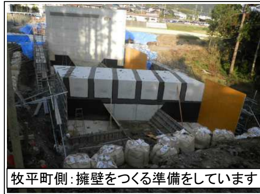
牧平町側：擁壁をつくる準備をしています