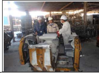
使用する材料を工場で検査しています