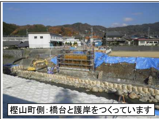
檜山町側：橋台と護岸をつくっています